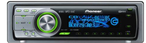
Double éclairage des touches (Rouge / Vert)