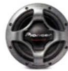
TS-W307D2 avec UD-G307